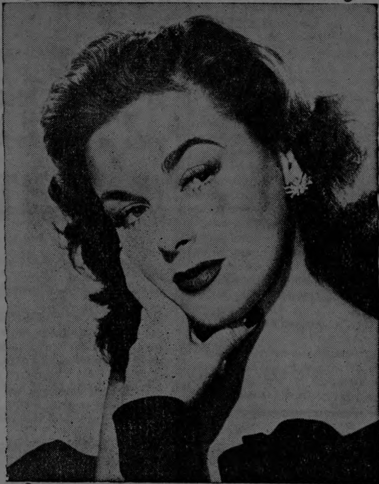
Marguerite Chapman, la adorable estrella de la Columbia es un perfecto ejemplo de la importancia de

Aplicúese el colorete a toques con una mota. No se lo frote y no emplee la mota para desvanecerlo. No hay nada como la punta de los dedos para esta delicada operación. Este desvanecimiento del color debe continuar hasta que no se note una línea aparente